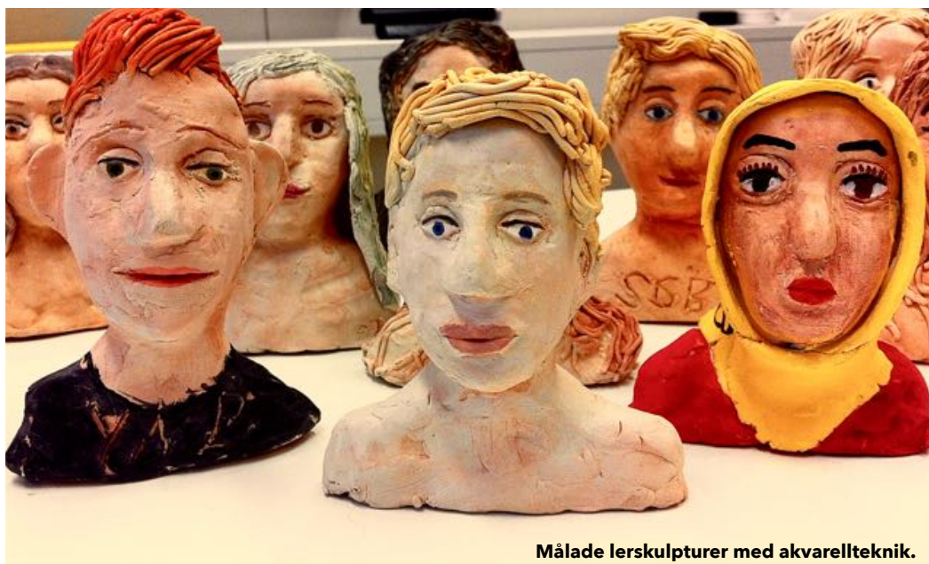
Målade lerskulpturer med akvarellteknik.