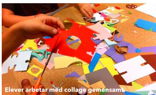
Elever arbetar med collage gemensamt

På sida 2 finns sammanfattande info om hur varje delmoment i upplägget ser ut, vilka material och verktyg vi arbetar med samt prisuppgifter. Ni väljer själva om ni vill boka ett, flera eller alla besök i projektet.